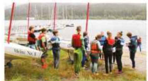
Auch in diesem Jahr veranstaltet die bsj wieder ein Camp am Schluchsee.

Kosten: 110 Euro inkl. Vollpension und Verleih von Sportgeräten