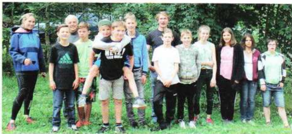
Die Teilnehmer und die Betreuer erlebten ein tolles Wochenende