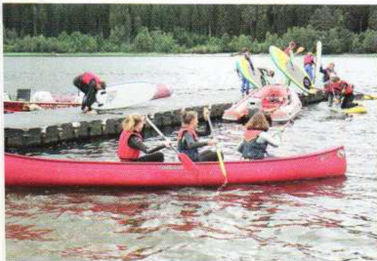
Ab aufs Wasser ging es mit den Stand-Up-Boards und mit dem Kanu

Wenn ihr auch Lust habt auf ein erlebnisreiches Wochenende auf dem Wasser, ein sportliches Camp im Schnee oder einfach mal auf eine Freizeit, bei der ihr mit anderen Kindern und Jugendlichen gemeinsam die verschiedensten Sportarten ausprobieren könnt, dann schaut doch mal auf unserer Homepage vorbei www.bsj-freiburg.de vorbei.